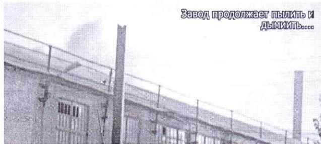
Завод продолжает пылить и ДЫМИТЬ!

Вывод рабочая группа еще не сделала. Сами того не предполагая, наши районные депутаты бегут впереди паровоза, заявляя, что уже заметили положительные изменения на бывшем огнеупорном заводе.